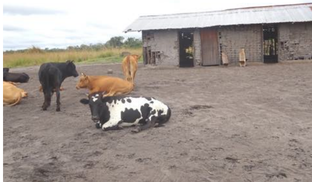
Les bêtes devant la ferme de Yambenga

Dans la région équatoriale de la RD Congo, l'ONG « Maboko Lisanga » mène plusieurs projets de développement que nous soutenons, comme :