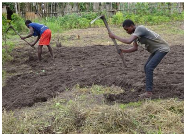
Défrichage et préparation d'un champ